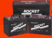
ROCKET BATTERY JIS